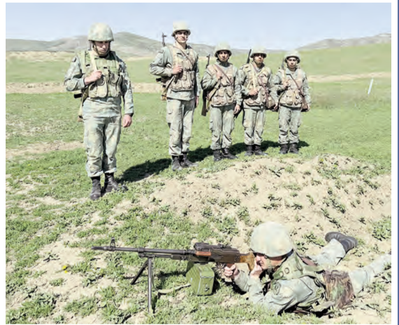
karlıdır. Təlim meydanında əsgərlər durmadan dərsin

Əsgəri sevdirən, uca edən onun ruh yüksəkliyi və peşə-